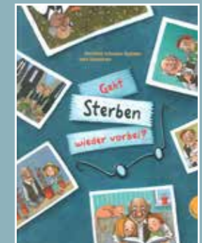
Geht sterben wieder vorbei?, Mechthild Schroeter-Rupieper; 14 €