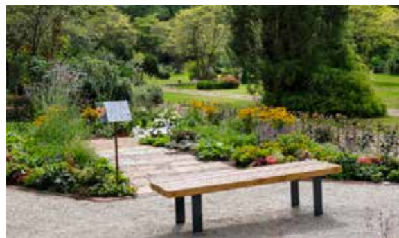
Der Bestattungsgarten auf dem Heger Friedhof wirkt wie ein Parkbeet.

Er könne das verstehen, aber dadurch hätten die Friedhofsgärtner viel