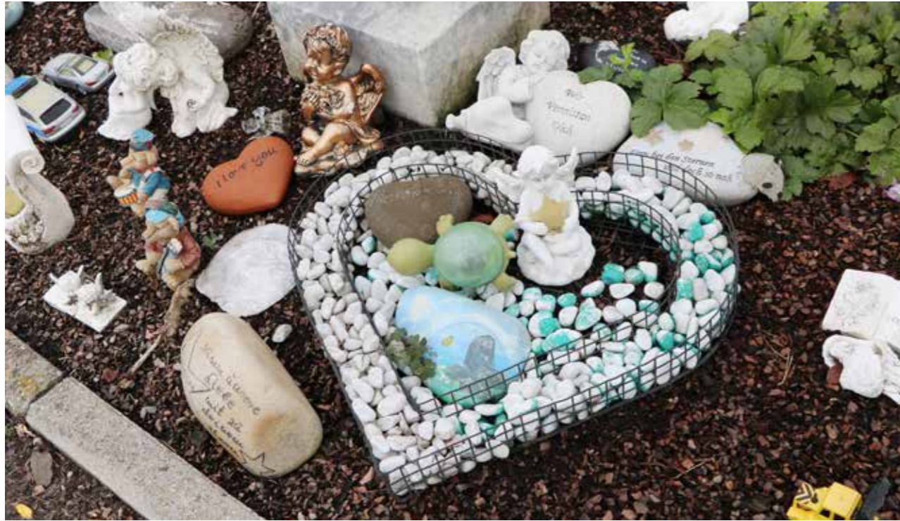
Die Sternenkindergabstelle in Voxtrup mit Spielzeug und Gedenksteinchen