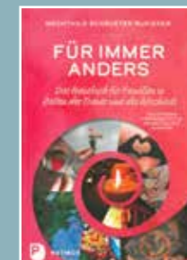
Für immer anders; Mechthild Schroeter-Rupieper; 25,- €