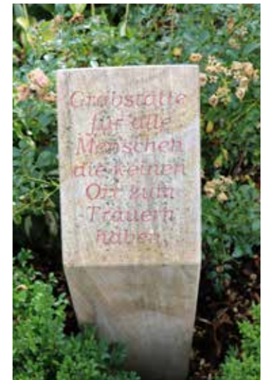
Der Gedenkort für Menschen, die sonst keinen Ort zum Trauern haben, ist auf dem Friedhof Voxtrup.

Außerdem hat die Friedhofsverwaltung vor einigen Jahren eine Gedenkstele aufgestellt „für alle Menschen, die keinen Ort zum Trauern haben“. Hier finden sich immer wieder Besucher ein und stellen Lichter ab. Sie verknüpfen den Ort mit dem Gedenken an eine bestimmte Person.