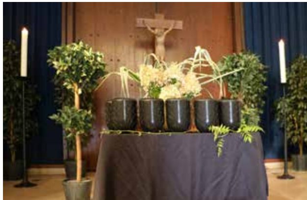
Urnen bei der städtischen Trauerfeier für Verstorbene ohne Angehörige.

Niemand sollte vergessen sein, keiner sollte allein zu Grabe getragen werden. Das ist die Überzeugung, die hinter den städtischen Trauerfeiern für Verstorbene ohne Angehörige steht. Es geht um Männer und Frauen, die keine bestattungspflichtigen Angehörigen haben, weshalb