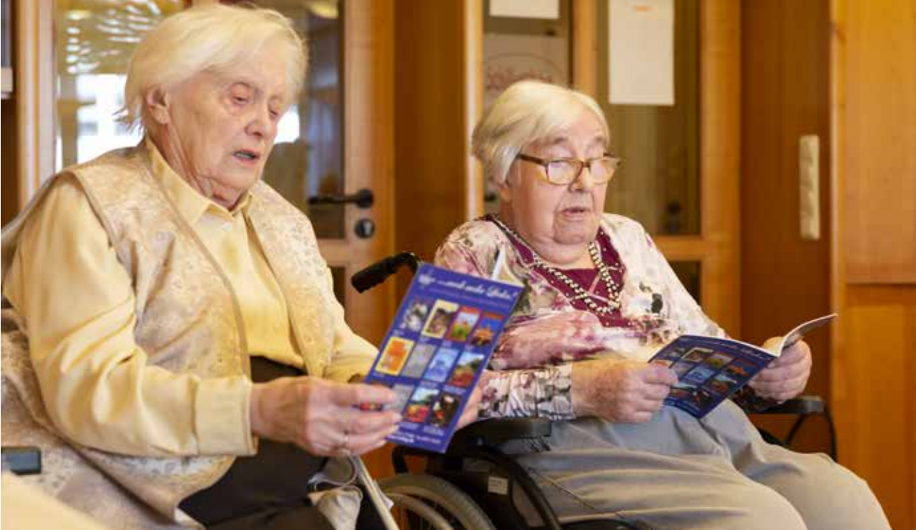
Nicht ohne mein Liederheft: Beim Singenachmittag dürfen auch Lieder vorgeschlagen werden.