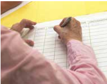
Wie früher: „Stadt-Land-Fluss“ fördert das Erinnerungsvermögen.

neue Bewohner noch, was kann in ihm neu angestoßen werden? „Wir können Anregungen geben, sich wieder neu zu bewegen, wir können dazu ermutigen, Dinge wieder selbst zu tun und die Selbstständigkeit fördern.“ Manchmal ist Zuspruch nötig, damit jemand wieder in eine größere Runde kommt. Das kann für den Einzelnen anstrengend sein. Aber die Häuser wollen eine Atmosphäre schaffen, in der er spürt, dass sich diese Investition lohnt.