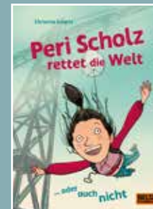
Peri Scholz rettet die Welt, Christina Erbertz; 13,- €