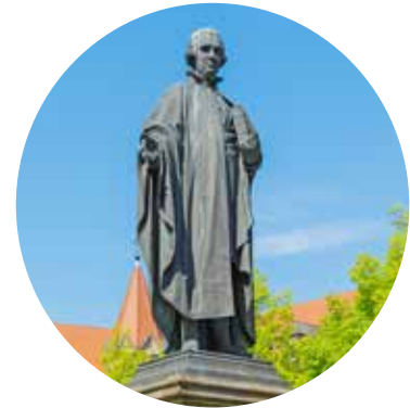
Das Möser-Denkmal thront über der Großen Domsfreiheit.

Wer Justus Möser besser kennenlernen möchte, kann sich auf einer Homepage umfassend über Leben und Wirken des großen Osnabrückers informieren: www.justus-moeser.de