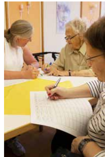
Hilfestellung: Mir fällt gerade keine Stadt mit „L“ ein.

Text: Matthias Petersen